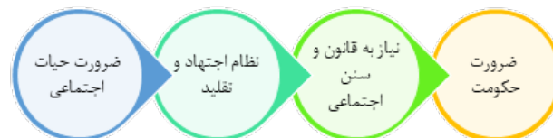
شکل ۱: مراحل حیات اجتماعی انسان بر اساس طرح علامه طباطبایی

در طرح علامه طباطبایی سازمان ولایت تنها روح حیات‌بخش به جامعه معرفی می‌شود، زیرا تنها با وجود چنین سازمانی حفاظت و حراست از جامعه شکل می‌گیرد و تنها به این واسطه است که احکام اسلامی به عنوان قوانین سعادت بخش فرد و جامعه به صورت کامل و در همه لایه‌ها و سطوح جامعه ایمانی اجرا خواهد شد. به همین دلیل می‌توان گفت در طرح ایشان به صورت منطقی جهت حفظ مرجعیت دین در ساحت جامعه و سیاست، اصلاح سازمان ولایت و اقامه و برقراری سازمان ولایت اسلامی بر هر اصلاح دیگری مقدم شده است.